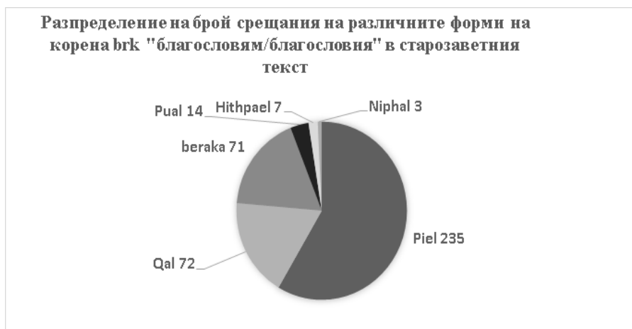
(фиг.2: Разпределение на брой употреби на построенията (бенианими) на корена brk „благославям/благословия“ в старозаветния текст. Изходни данни: Wehmeier, допълнени от Mitchell, Приложение 1. Графика: К. Гр.)

След разработките на Wehmeier и Mitchell по-обстойни изследвания върху благословиата в Стария Завет се правят през систематично-богословски аспект – в монографията на Magdalene Frettlöh „Теология на благословиите: библейски и догматични възприятия“ 22 . Martin Leuenberger в дисертационното си изследване „Благословии и богословие на благословиата в древен Израел. Проучвания върху техните религиозни и теологично-исторически взаимоотношения и трансформации“ успешно прилага интердисциплинарен подход, за да представи „... един обобщен тематичен синтез на благословиата, който поставя в диахронна последователност синхронните напречни сечения на древен Израел според първични и вторични източници. По този начин най-важните благословии и трансформации, които са откриваеми в първичните и вторични източници в древен Израел, са обобщени в история на темата за благословието в древен Израел, без обаче да се повтарят подробно вече обобщените индивидуални резултати по различните изходни източници.“ 23